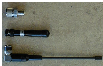
UHF-BNC Adapter art.30-10011